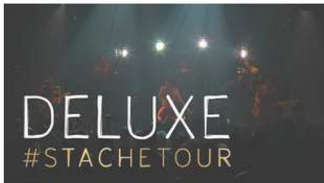
Deluxe - Daniel (extrait live)