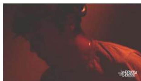
Apero Mix'l Techno Drum'n'Bass