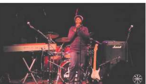
Scène ouverte 9 mars 2016 : théâtre, danse, chant, musique...