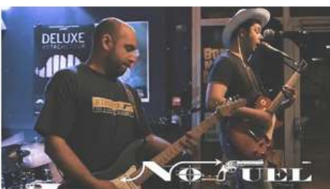
No Fuel - Search & Destroy (reprise des Stooges)