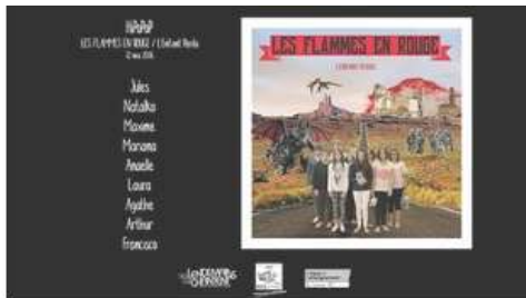
Les Flammes en rouge - L'enfant perdu (live) - HIPOPOP