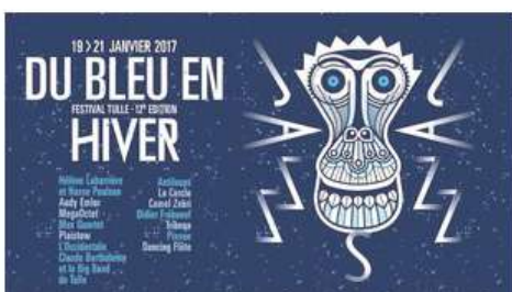
Teaser Festival Du Bleu en Hiver 12ème édition