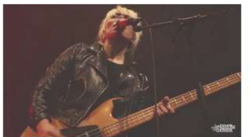
Capsula - Santa Rosa (live)