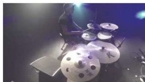
KRÛT - Repérages #4