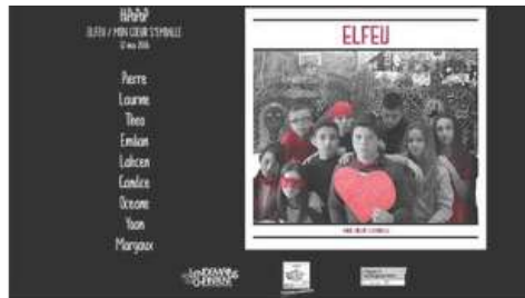
Elfeu - Mon coeur s'emballe (live) - HIPOPOP