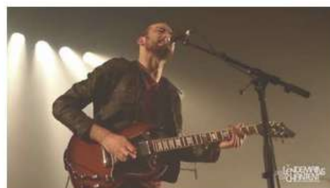
Gunwood - Traveling Soul (live)