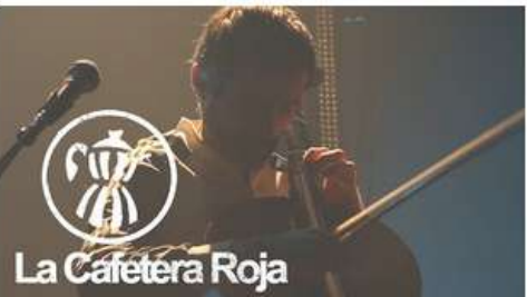
La Cafetera Roja - Weird Master Piece (live)