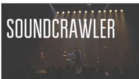
Soundcrawler - A God To Feed (live)