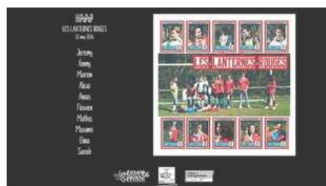
Les Lanternes Rouges (live) - HIPOPOP