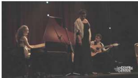
Love I Obey - Evening Hymne (live)