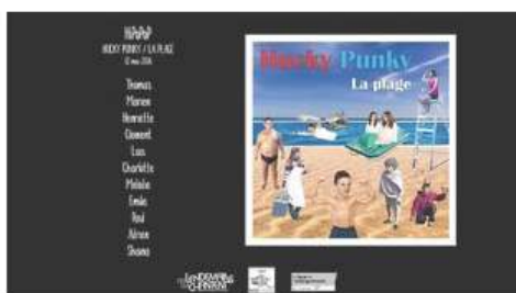
Hucky Punky - La Plage (live) - HIPOPOP