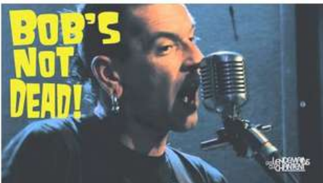
Bob's Not Dead - Rock'n Roll Vespa (live)