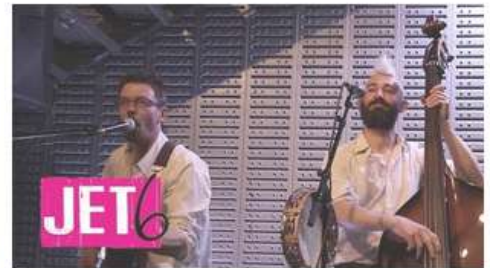
Jet 6 - Gare au gorille VS Mexico