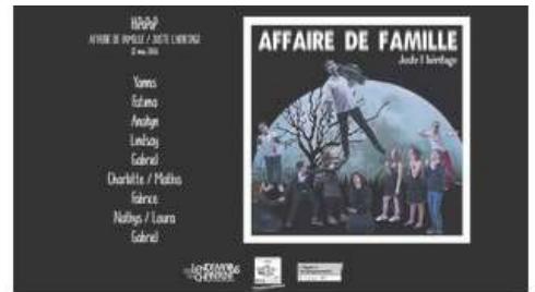
Affaire de famille - Juste l'héritage (live) - HIPOPOP