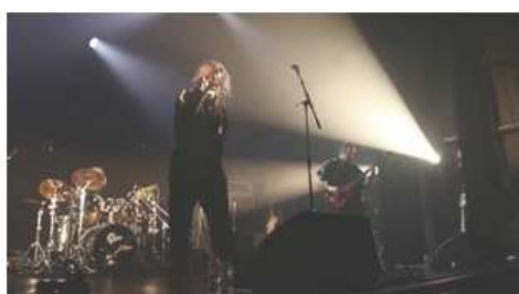
Ali-N - Repérages #4