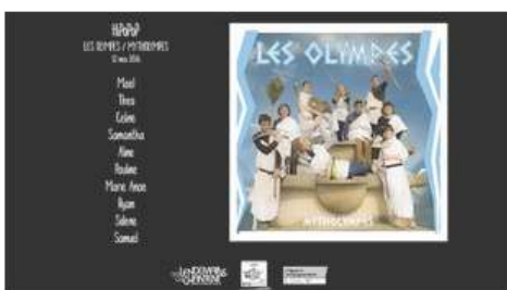
Les Olympes - Mytholympes (live) - HIPOPOP