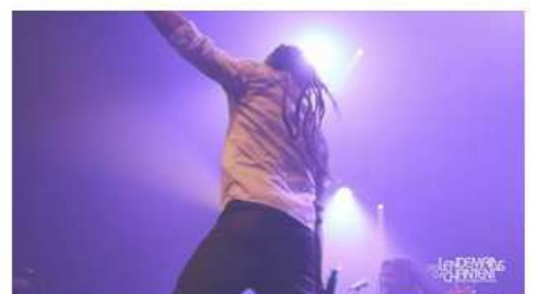
Sinsemilla - Warning (live)