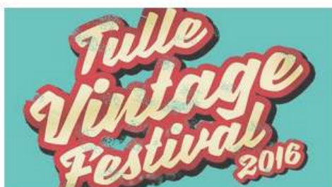
Tulle Vintage Festival #1