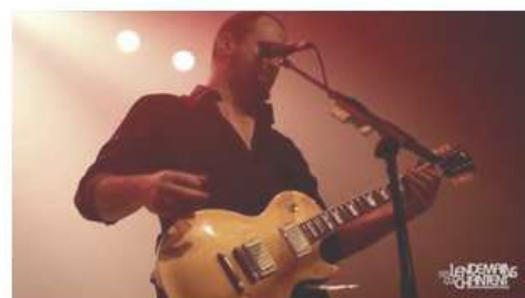
Mountain Men - Still In The Race (live)