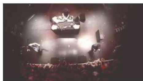
Hippocampe Fou - Evasion (live)