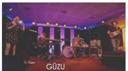
GÜZU - Festival Du Bleu en Hiver 2016