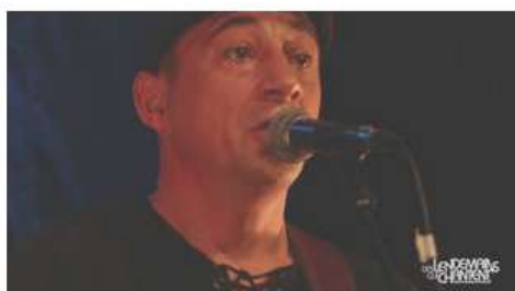
AJM - La valse des cons (live)